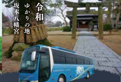
令和 ゆかりの地 坂本八幡宮