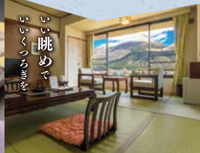
いい眺めで ごくろろきを