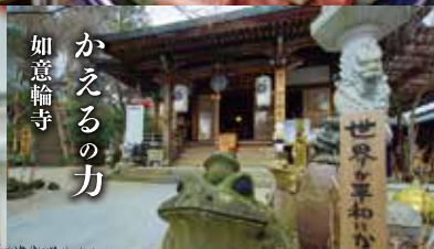
かえるの力 如意輪寺