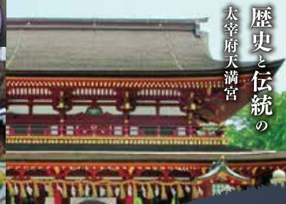
歴史と伝統の 太宰府天満宮