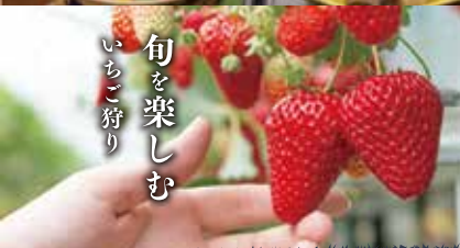
旬を楽しむ いちご狩り