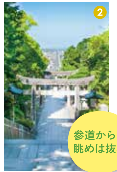
参道からの眺めは抜群

1日目は、九州屈指のパワースポット「宮地嶽神社」でお参りして、開運パワーをチャージ！ 2日目は、佐賀県神埼市にある「王仁博士顕彰公園」と「ヤクルト工場」を見学して、深い歴史と工業の盛んな佐賀の魅力に迫る！